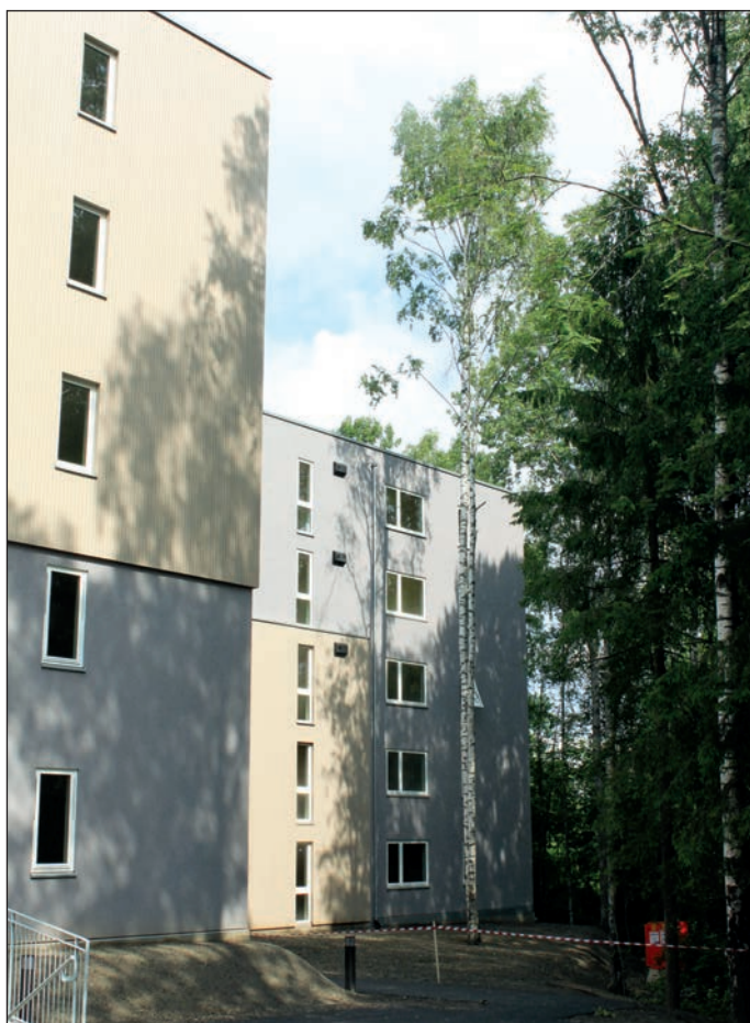
Boligene ligger helt inntil tregrensen i Østmarka.